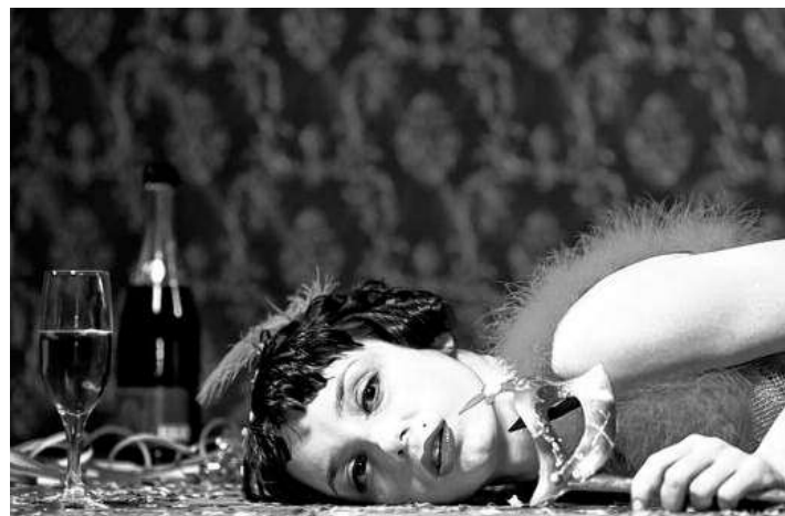
Saisongerecht werden im Februar anlässlich des Karnevals in «Eine Nacht in Venedig» zahlreiche Intrigen gesponnen.