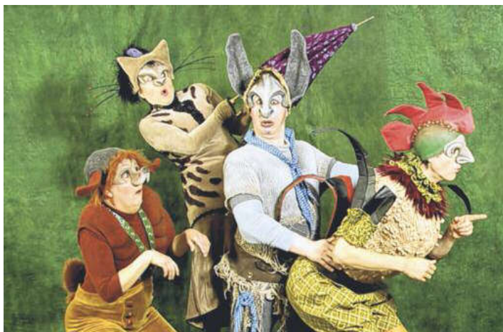
Wo geht's hier nach Bremen? Am 8. Dezember brechen die «Stadt Musikanten» zu ihrer Reise auf.