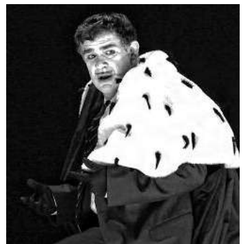
Den Schlusspunkt bildet «Rigoletto».

Einzelvorführungen seien in vergleichbaren Gastspielhäusern auch schlicht üblicher. «Wir waren Exoten und werden jetzt normal», meint Schneuwly lachend.