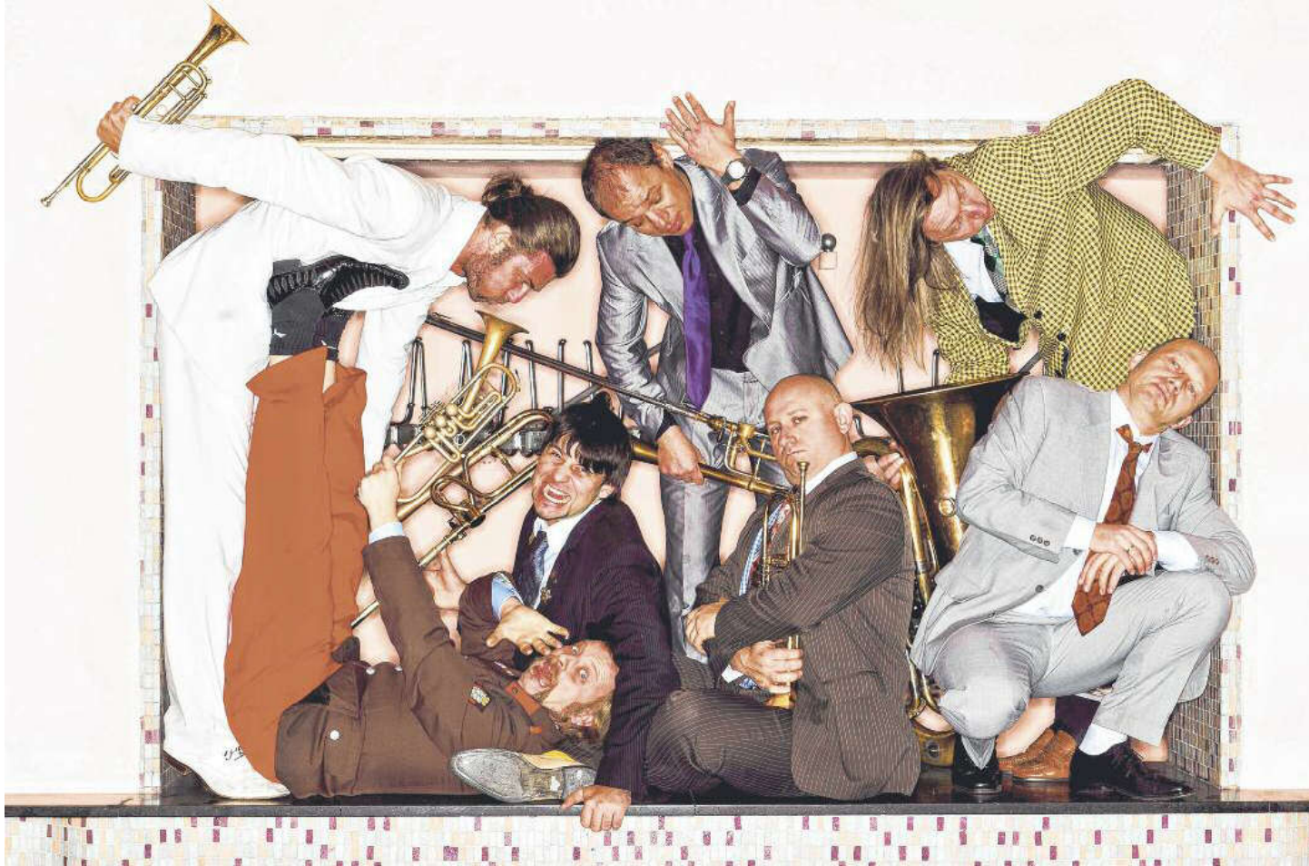
Eine geballte Ladung Brassband-Power: Die Musiker von Mnozil Brass werden Ende Januar 2013 im Podium Düdungen einheizen.