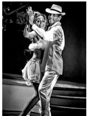
Kuba pur: «Pasión de Buena Vista».